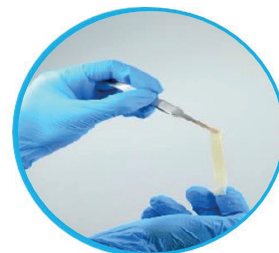
Elasticitet og forlængelse